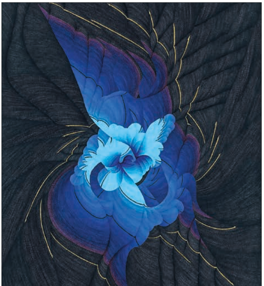
Acylfarbe mit Patronenfüller auf Karton (im Original 50x35 cm)